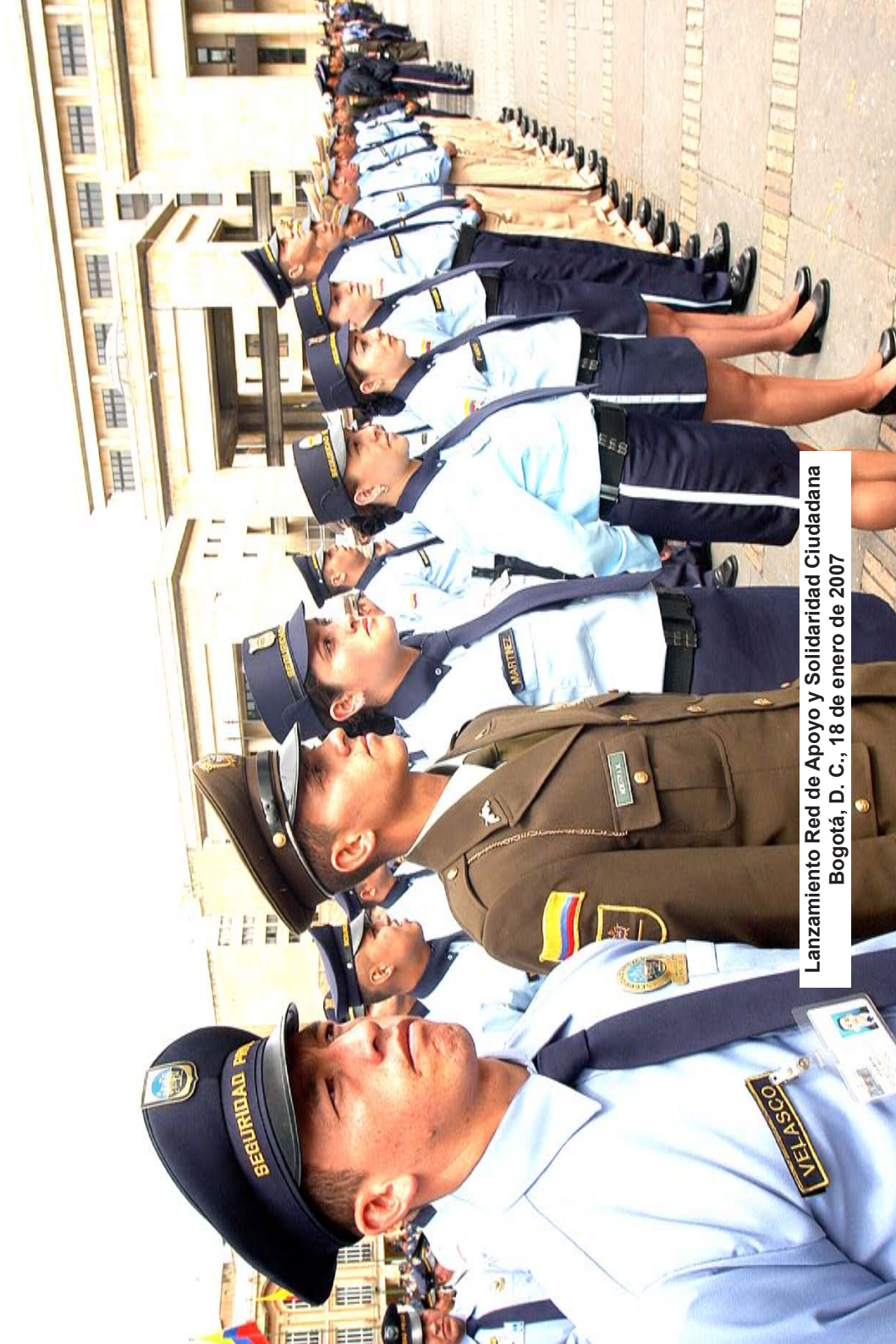
Lanzamiento Red de Apoyo y Solidaridad Ciudadana Bogotá, D. C., 18 de enero de 2007