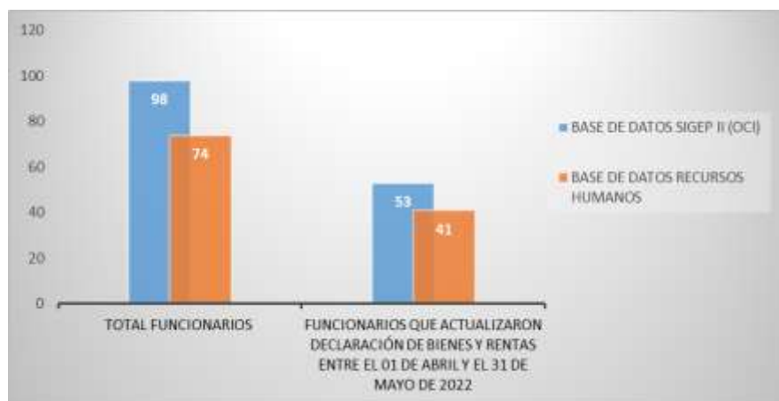
Gráfica No. 4. Funcionarios que actualizaron declaración de Bienes y Rentas según la norma

2.1.2 Una vez cotejada la información suministrada por el Grupo de Recursos Humanos y la base exportada de la Plataforma SIGEP II, el equipo auditor observó que de los 98 funcionarios activos en la Entidad según la Plataforma SIGEP II, 53 reportan actualización de Declaración de Bienes y Rentas en la vigencia 2022, y de los 74 registrados en las bases de datos del Grupo de Recursos Humanos 41 presentan la correspondiente actualización, en cumplimiento a lo establecido en el literal a), artículo 2.2.16.4, Decreto 484 del 2017 que a la letra dice “ARTÍCULO 2.2.16.4. Actualización de la declaración de bienes y rentas y de la actividad económica. La actualización de la declaración de bienes y rentas y de la actividad económica será efectuada a través del Sistema de Información y Gestión de Empleo Público-SIGEP y presentada por los servidores públicos para cada anualidad, en el siguiente orden: Servidores públicos de las entidades y organismos públicos de orden nacional entre el 1º de abril y el 31 de mayo de cada vigencia. (...)” (Subrayado y Negrilla fuera de texto).