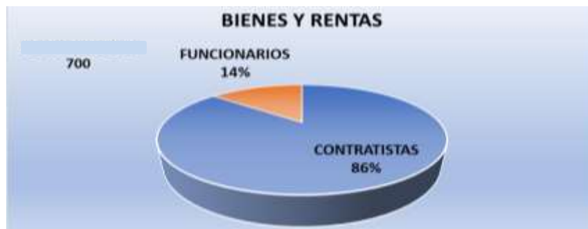
Gráfica No.3. Declaración Bienes y Rentas.

Una vez revisada y analizada la información contenida en las bases de datos vs el cargue y actualización de la información correspondiente a declaración de bienes y rentas de funcionarios y contratistas, el equipo auditor observó que a la fecha del seguimiento, la entidad contaba con 700 registros, de los cuales, 98 corresponden a funcionarios públicos de planta distribuidos en las diferentes dependencias que conforman la entidad y 602 contratistas de prestación de servicios que sirven como apoyo al cumplimiento de los objetivos institucionales, para que la entidad adelante una buena gestión. (Ver gráfica 3)