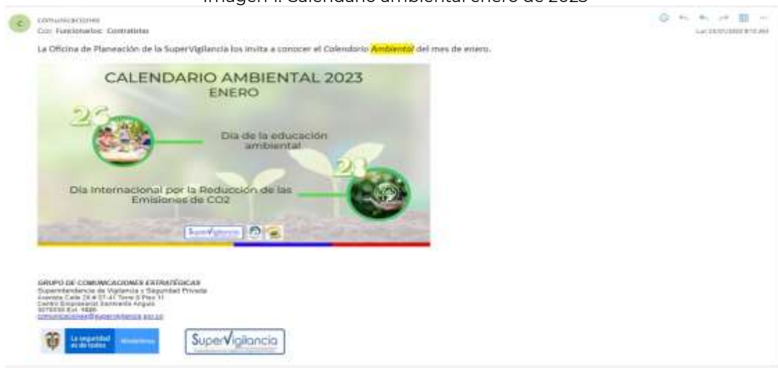
Imagen 1. Calendario ambiental enero de 2023