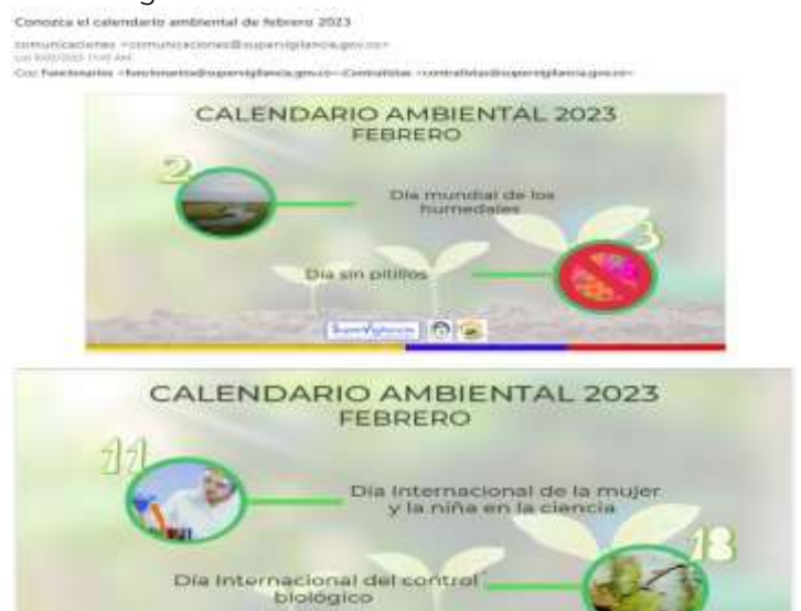
Imagen 2. Calendario ambiental febrero de 2023