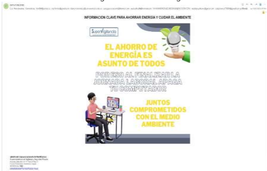
Imagen 3. Ahorro de energía