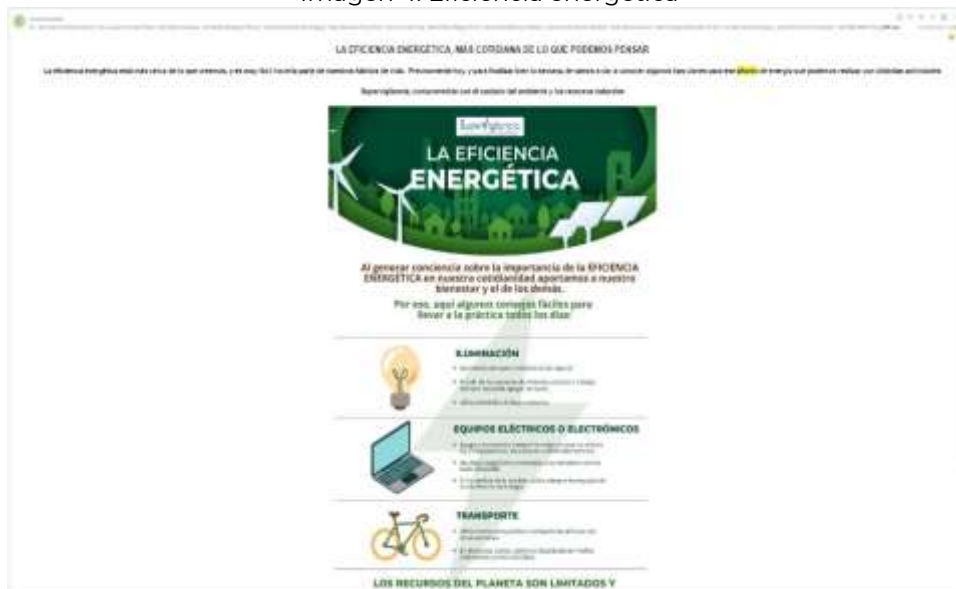
Imagen 4. Eficiencia energética