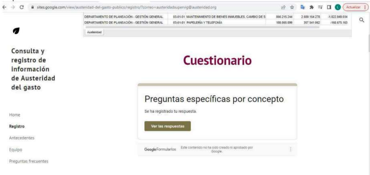
Imagen N° 3: Reporte I Semestre de 2023: