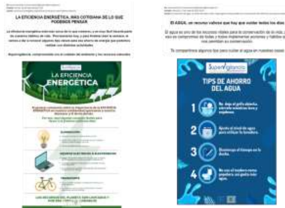
Imagen No 2: Infografía ahorro de energía y agua