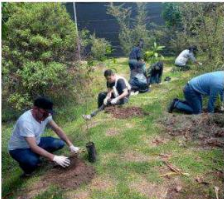
Tomada del MEMORANDO No.20243000017963 allegado a la OCI