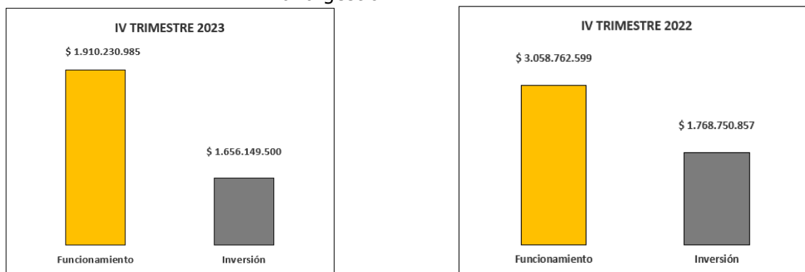
Gráfico N° 1 Cantidad de contratos de personal para la prestación de servicios profesionales y de apoyo a la gestión.

Elaboración propia OCI: Datos extraídos de SIIF Nación – Ejecución presupuestal (octubre a diciembre 2023 vs octubre a diciembre 2022)