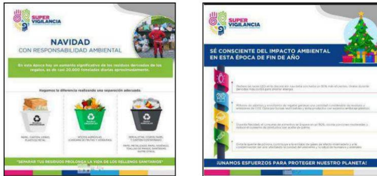
Tomada del MEMORANDO No.20243000017963 allegado a la OCI