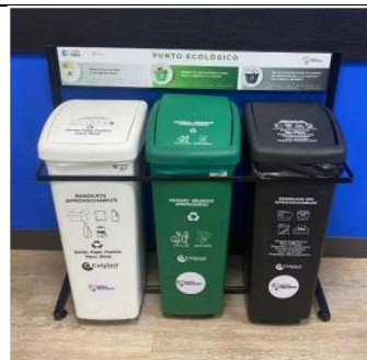
Tomada del MEMORANDO No.20243000017963 allegado a la OCI