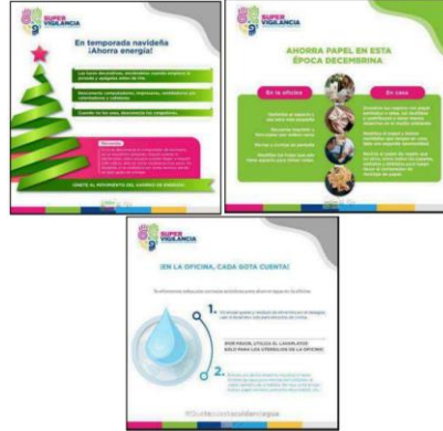
Tomada del MEMORANDO No.20243000017963 allegado a la OCI