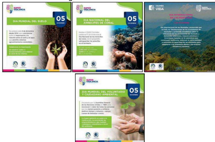
Tomada del MEMORANDO No.20243000017963 allegado a la OCI