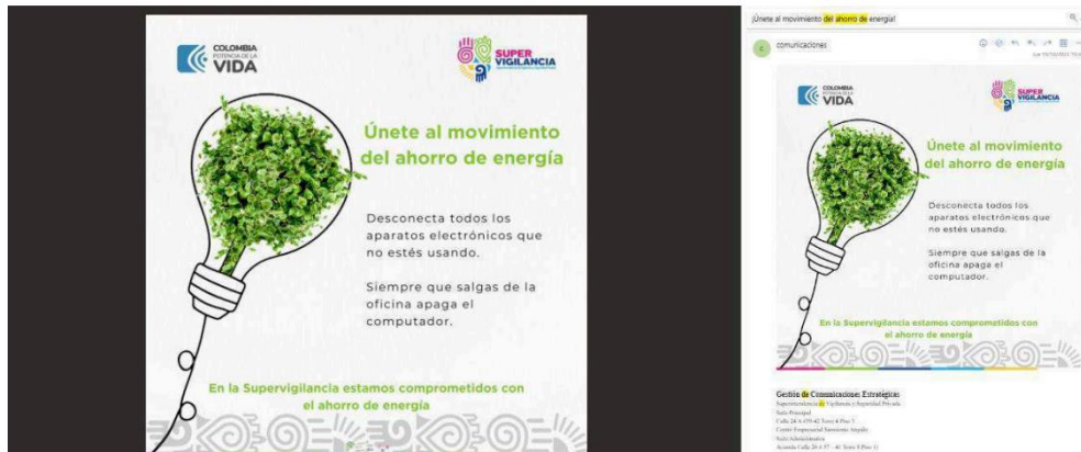
Tomada del Memorando N° 20233500125823 allegado a la OCI