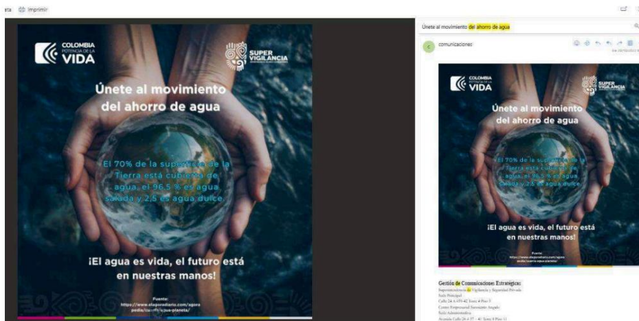
Tomada del Memorando N° 20233500125823 allegado a la OCI