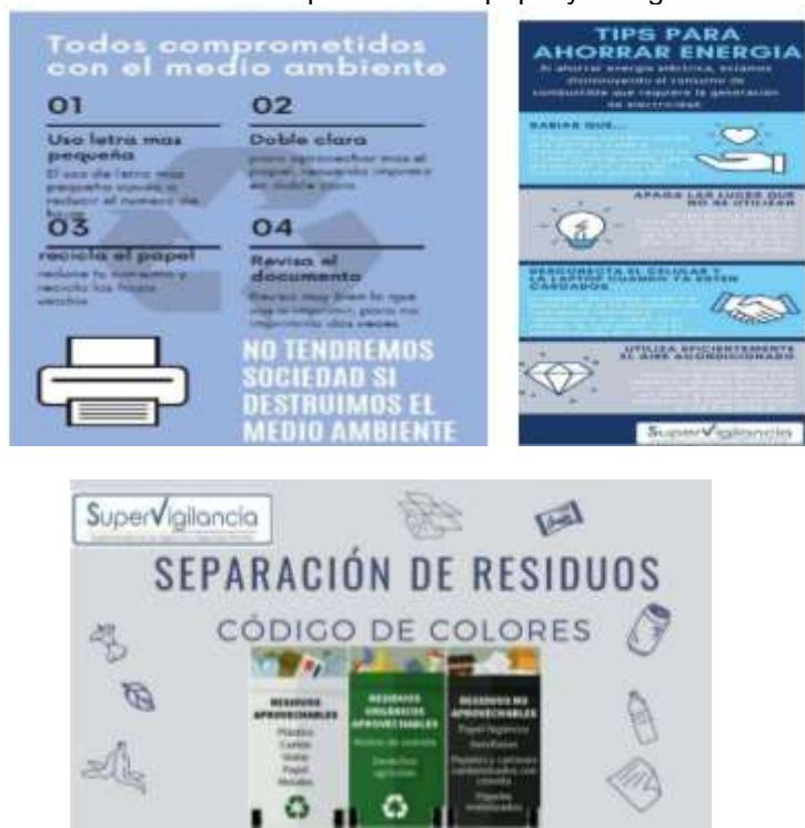
FIGURA No 3 Tips Ahorro de papel y energía