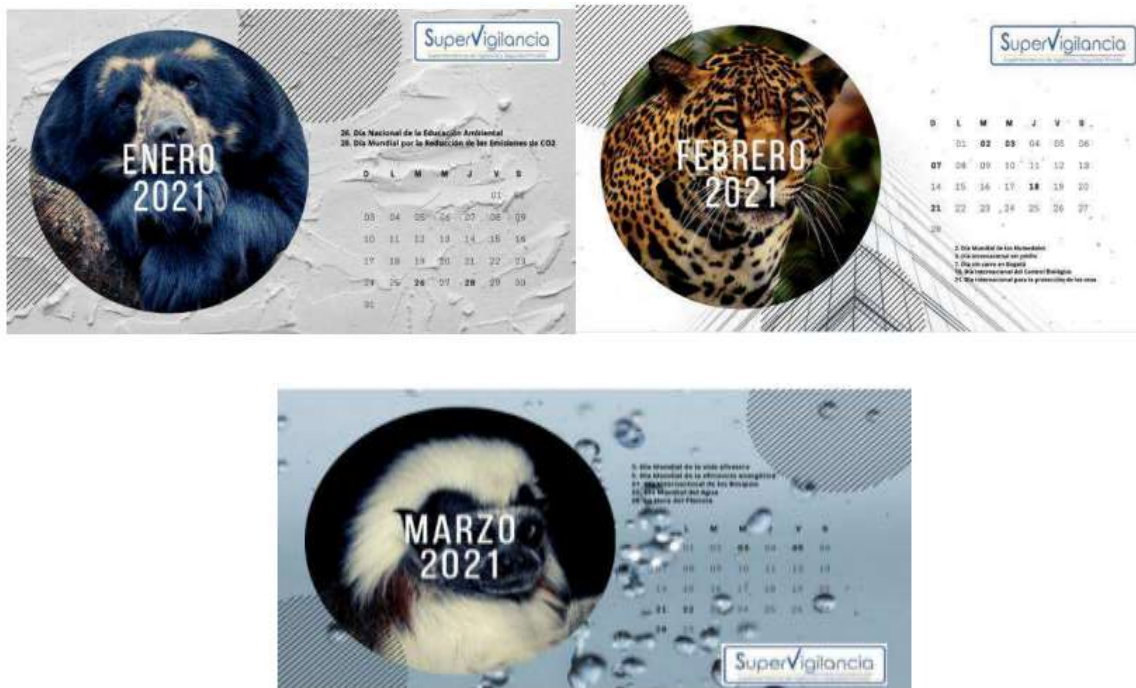
FIGURA No 1 Calendario ambiental Primer trimestre

De igual manera, se realizaron campañas ambientales referentes a las fechas especiales, las cuales se evidencian a continuación, en la Figura No 2