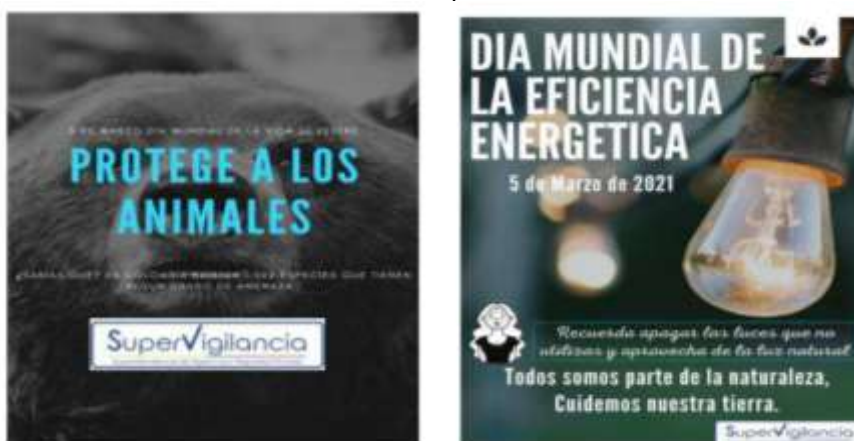
FIGURA No 2 Campañas ambientales

De igual manera, se realizaron campañas ambientales referentes a las fechas especiales, las cuales se evidencian a continuación, en la Figura No 2