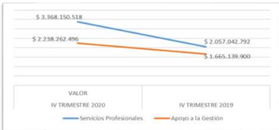
Gráfico No. 2- Pagos por contratación de prestación de servicios de Inversión

Fuente: Reporte de Obligaciones SIIF Nación – suministrado por el Grupo de Recursos Financieros